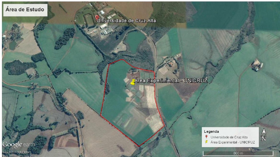
Figura 1. Área Experimental da Universidade de Cruz Alta (Lat. -28^{\circ} 34' 11'' e Long. -53^{\circ} 37' 18'' ).

Para obtenção das medidas foi utilizado paquímetro digital DIN 862 ® , para obter as medidas de largura foi tomada a distância entre os ângulos umerais do pronoto e para o comprimento desde o ápice da cabeça ao ápice do abdômen, para medir o comprimento do aparelho bucal foi tomada a distância entre a saída da cabeça até o ápice do rosto, sendo que todas as medidas foram dadas em milímetros.